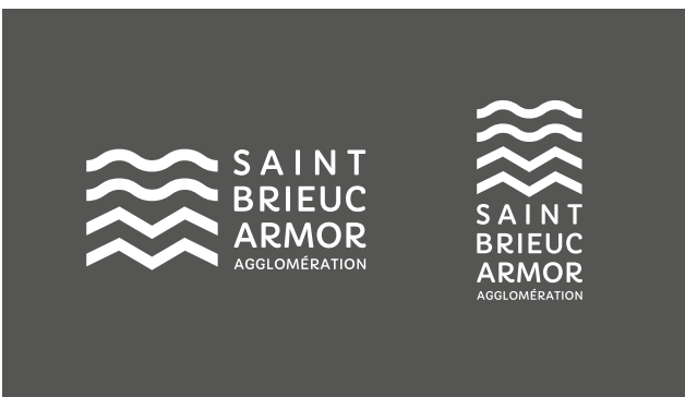
■ LOGO UNE COULEUR SUR FOND FONCÉ