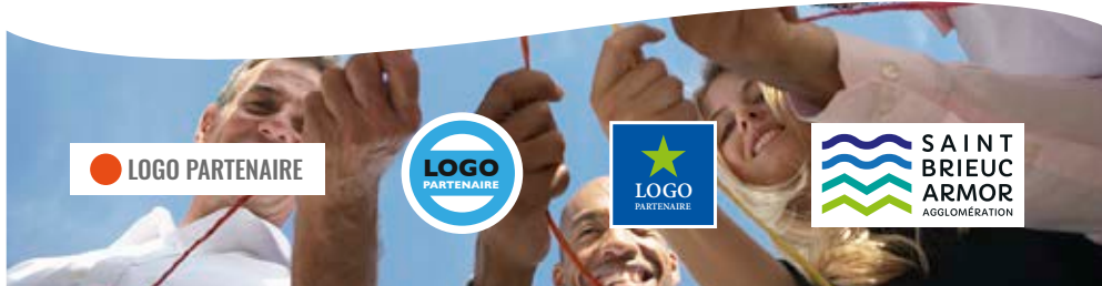
■ EN CO-SIGNATURE DE DOCUMENT SUR FOND PHOTO