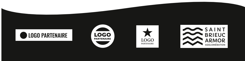
■ EN CO-SIGNATURE DE DOCUMENT SUR FOND NOIR & BLANC OU COULEUR