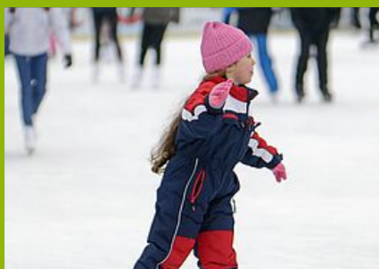
Cours enfants (moins de 16 ans)