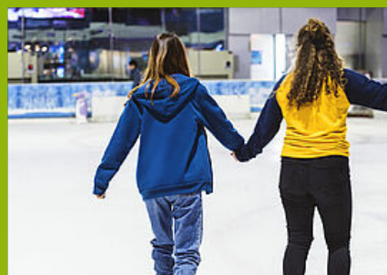
Cours ados / adultes