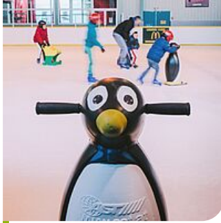
Pingouins pour l'apprentissage du patinage