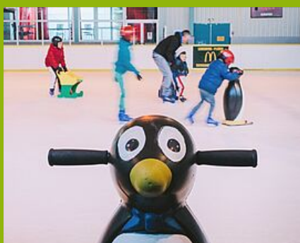
Jardin des enfants

≡ La patinoire, c'est aussi un équipement sportif !