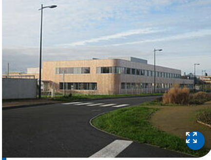
Le Centre Technique de l'Eau